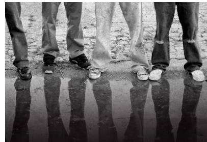
Gangs de rue