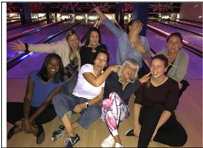
Maison de transition de Montréal