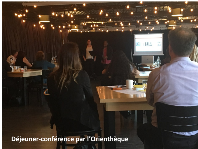
Déjeuner-conférence par l'Orienthèque