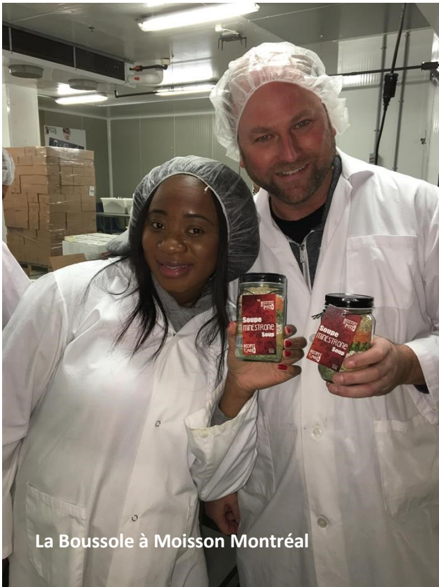
La Boussole à Moisson Montréal