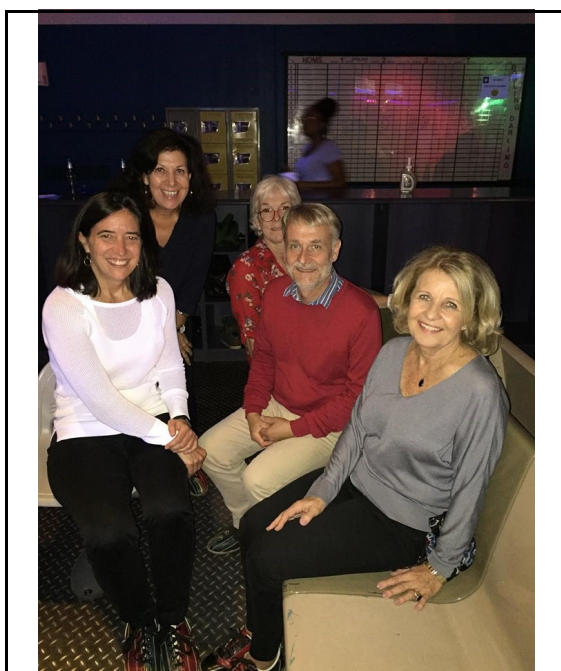
Cercles de soutien et de responsabilité du Québec