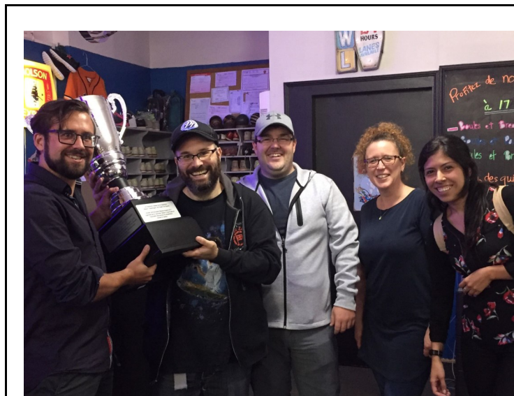
Les vainqueurs : Destroyers 3, Maison Charlemagne