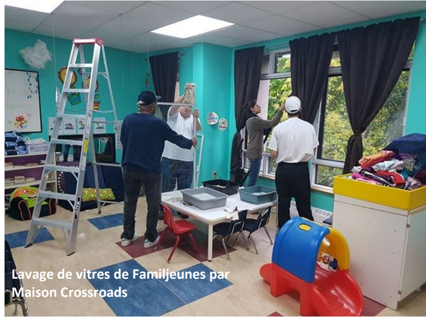
Lavage de vitres de Familjeunes par Maison Crossroads