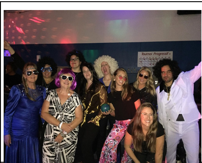
La Maison Joins-toi