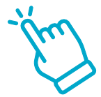
TABLE DES MATIÈRES INTERACTIVE